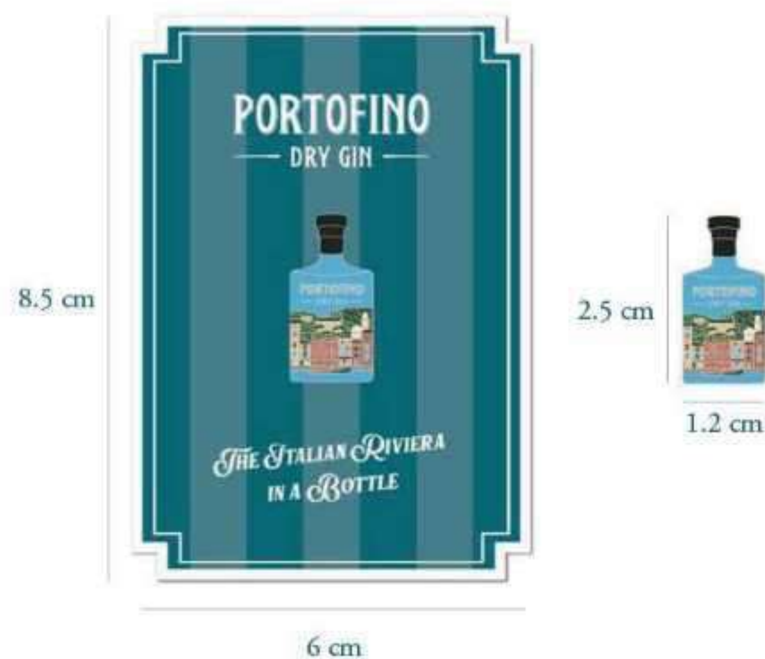
Pin em forma de garrafa