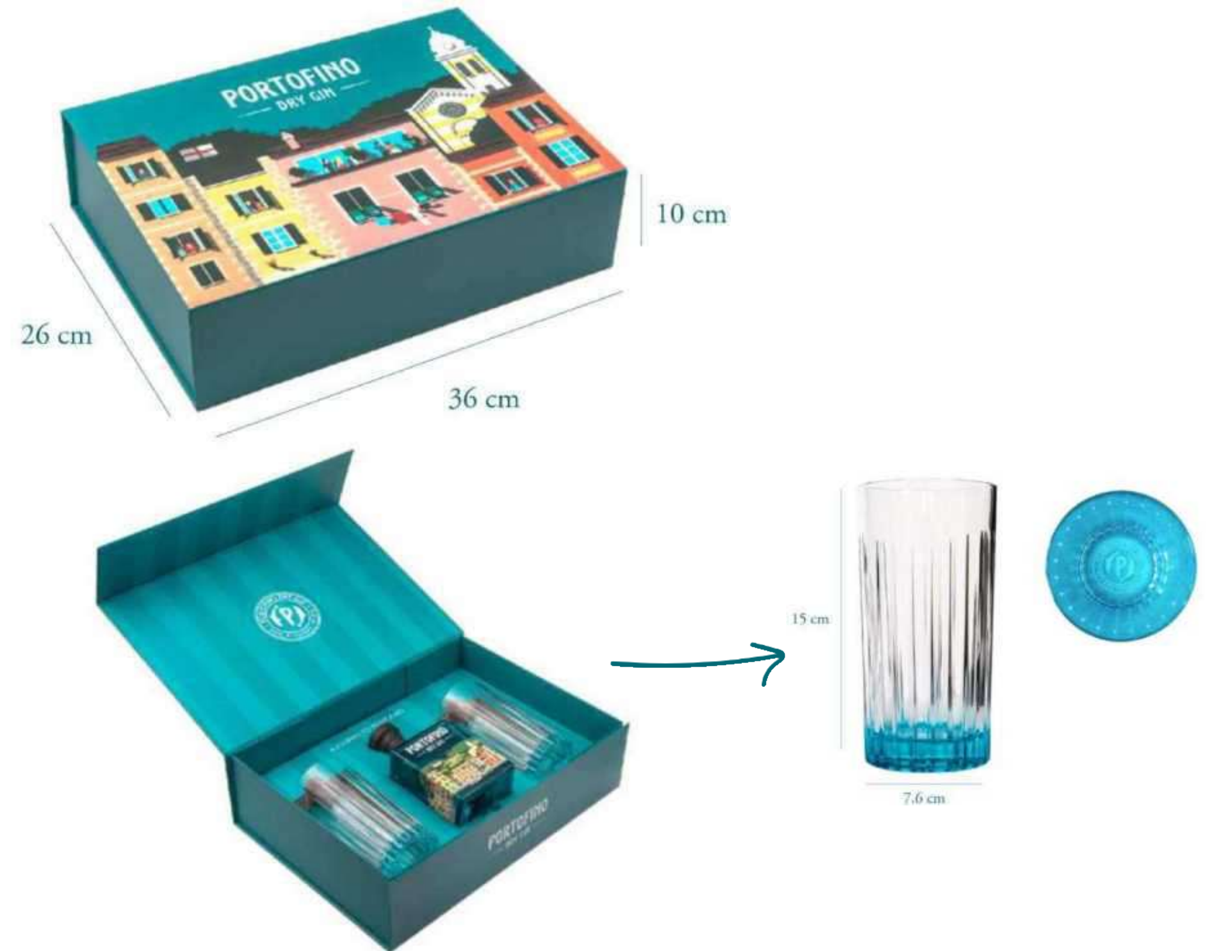
Caixa com garrafa 500 ml + 2 copos