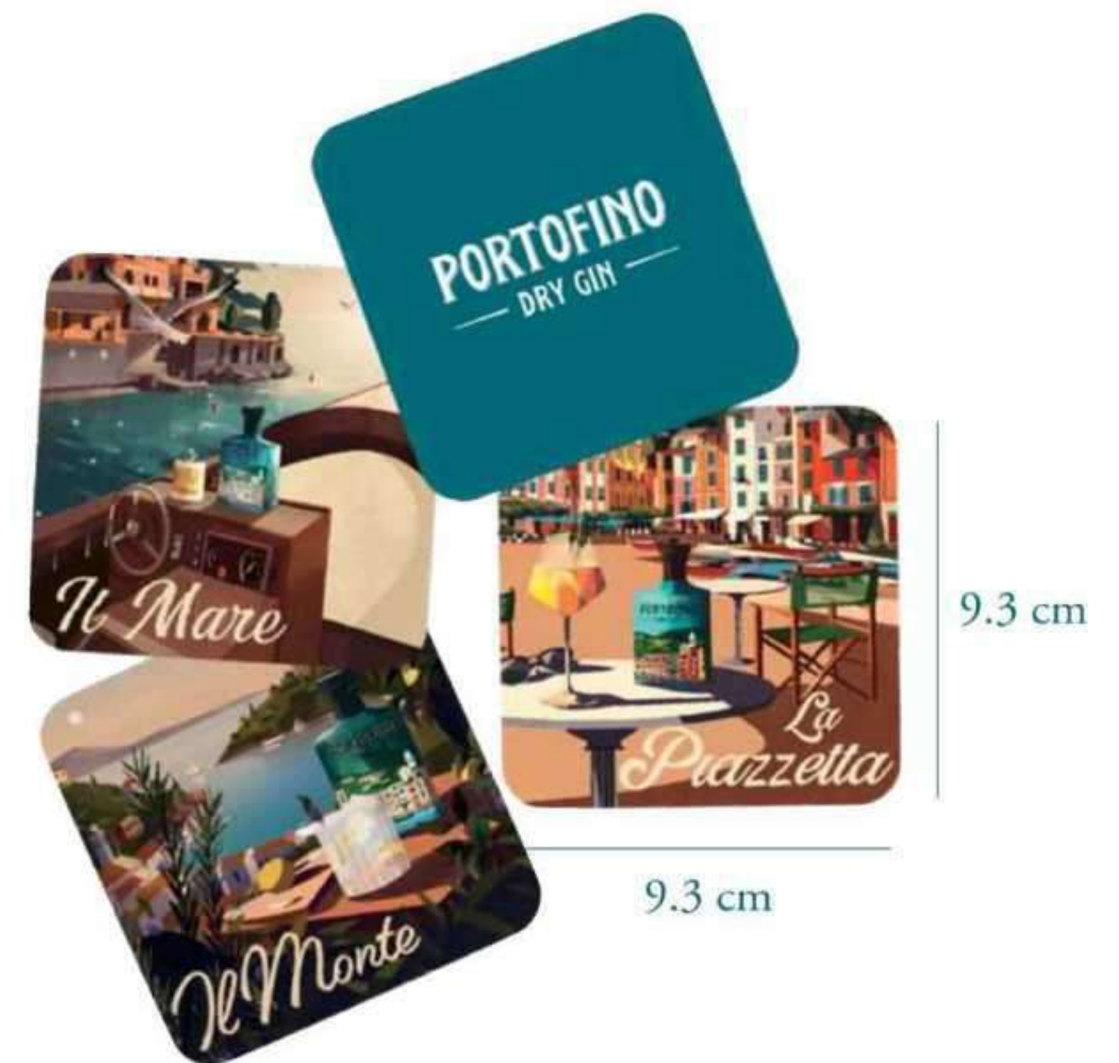
Base de copos ilustradas