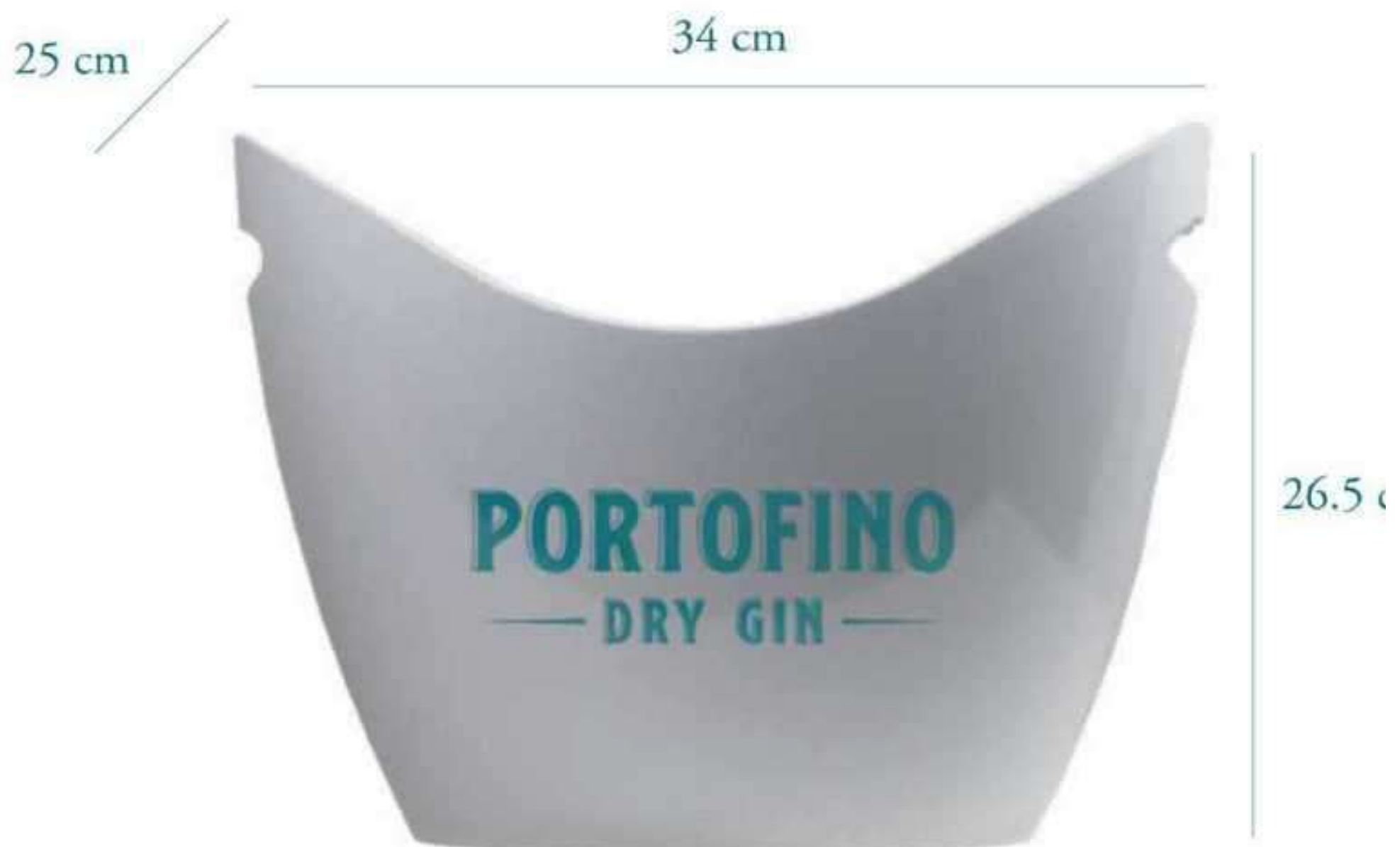
Balde para gelo