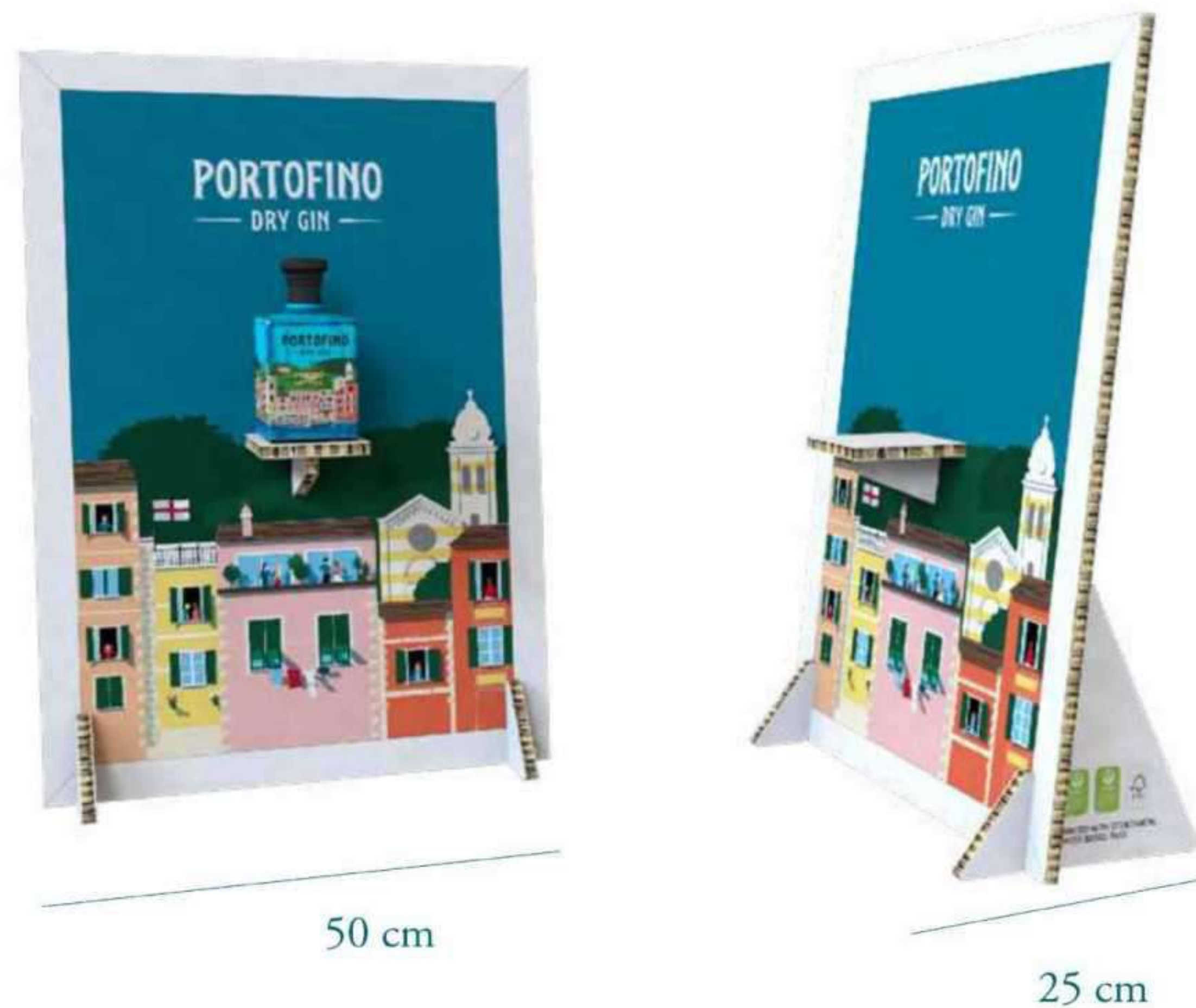
Expositor em cartão